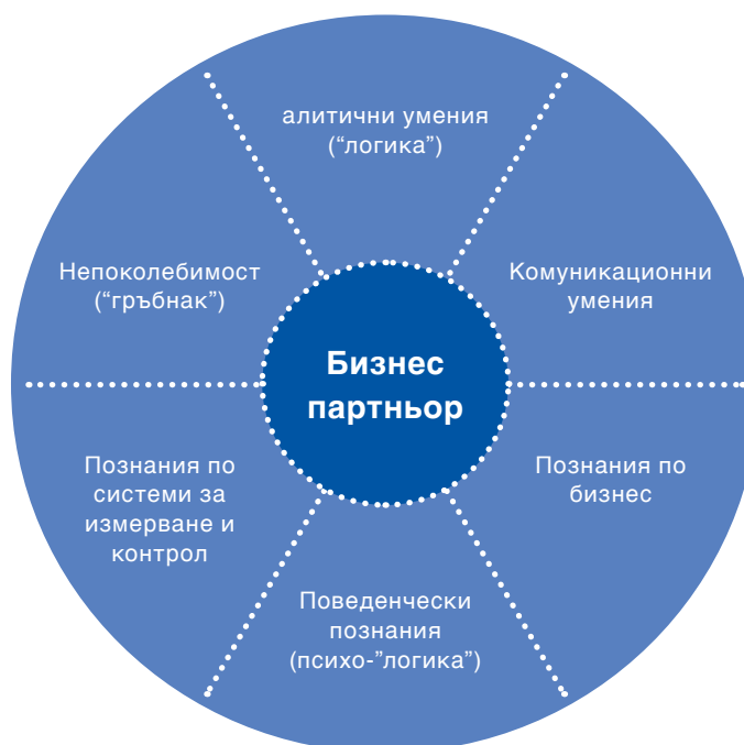
Фигура 4: Основни компетенции на контролерите